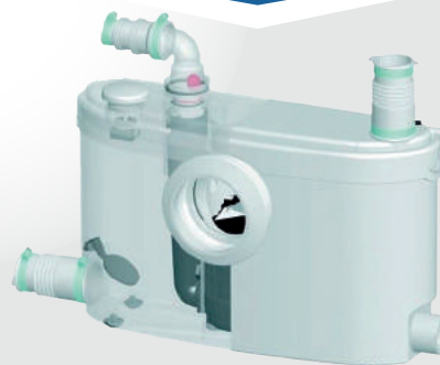
wysokość tłoczenia (m)